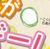
ちゃっぴー、石巻市門島