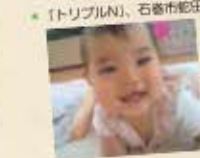
トリプルN、石巻市蛇田