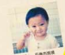
まこや、石巻市海濱