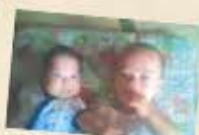
あっちゃんママ、石巻市蛇田