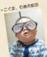
こくま、石巻市蛇田