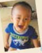
ひろママ、石巻市蛇田