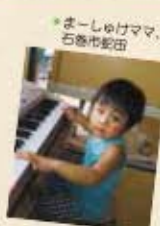
まーしゅけママ、石巻市蛇田