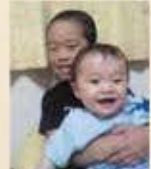
いびぐり姉主、新谷町