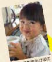
なの、石巻市あけぼの