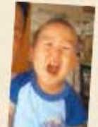
ゆうさん、栗松島市