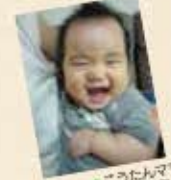
こうたんママ、石巻市中里