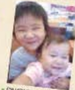
FIN宛洋、石巻市大街道