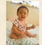
あおたん、石巻市水郷北