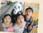
鳥ママ、石巻市河北