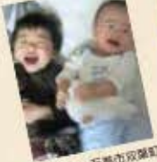
ゆかりん、石巻市双葉町