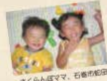
さくらんぼママ、石巻市蛇田