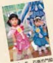
返りゆーあ、石巻市門島