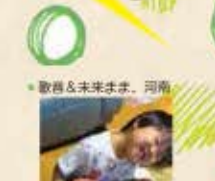
歌音&未来ママ、河南