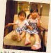
あんちゃん、石巻市大街道