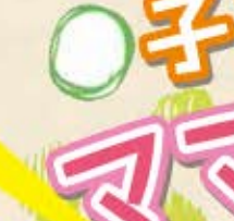
まこや、石巻市海濱