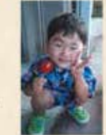
りっく、石巻市蛇田