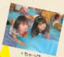
ちゃっぴー、石巻市門島