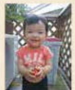
なちゅまほ、石巻市旭町