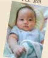
こくま、石巻市蛇田