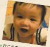
ひこくさ、栗松島市赤井