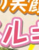
ハビクロ、栗松島市