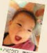
ハビクロ、栗松島市