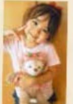
ジャスミン、石巻市