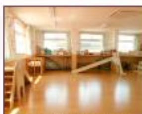
なかよし保育園(中里)