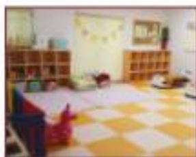
マタニティ・子育てひろば 「スマイル」(蛇田)