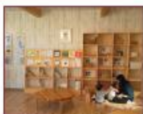
にじいろひろば(大街道)