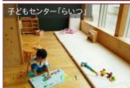
子どもセンター「らいつ」