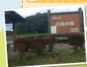
東松島市大塩字角柄 97