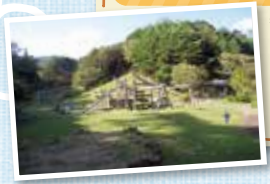
牡鹿郡女川町女川浜字大原190