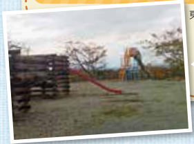
東松島市矢本上館下 118-4