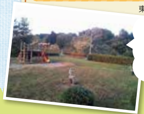
東松島市大塩字山崎5-1